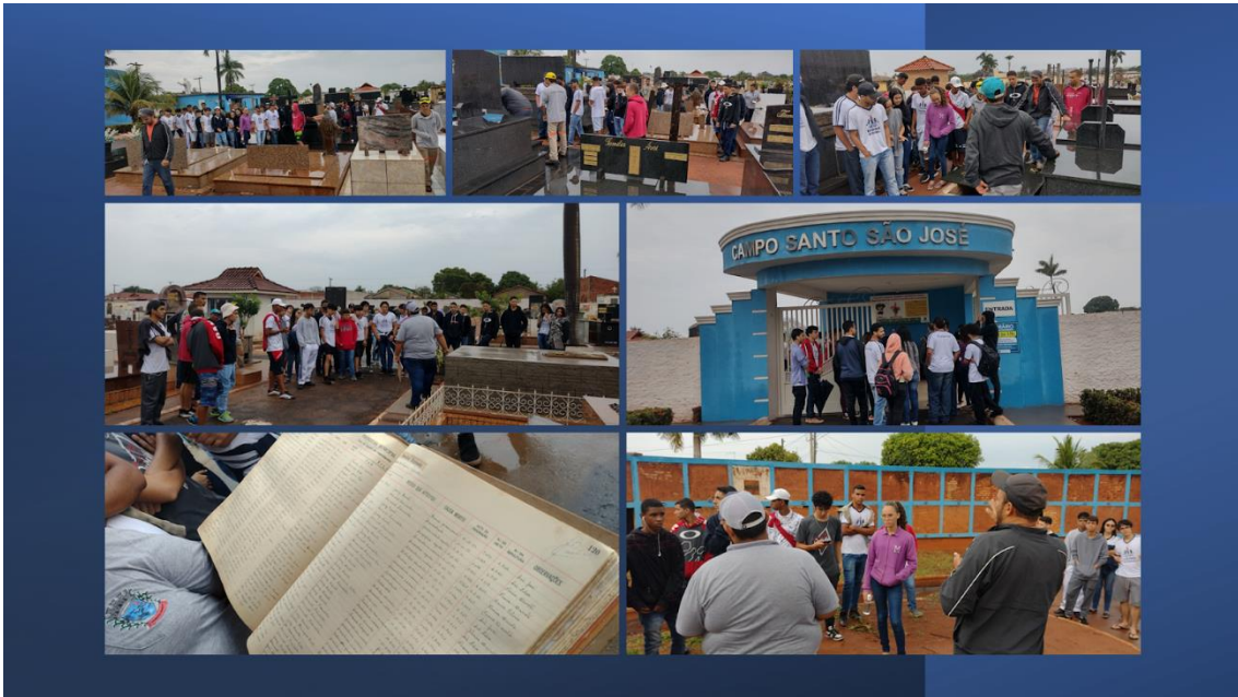
Imagem 10 - Visita Cemitério Campo Santo São José em Pereira Barreto/SP

Local: Cemitério Campo Santo São José em Pereira Barreto/SP