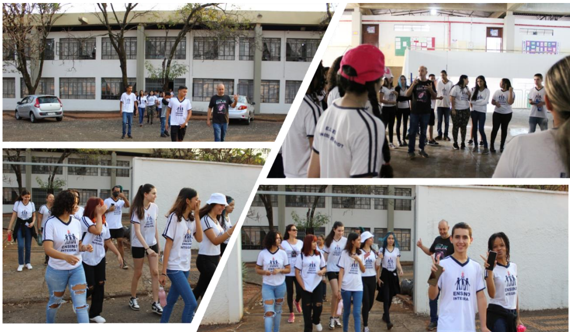
Imagem 4 - Saída da Escola E.E. Cel. Francisco Schmidt