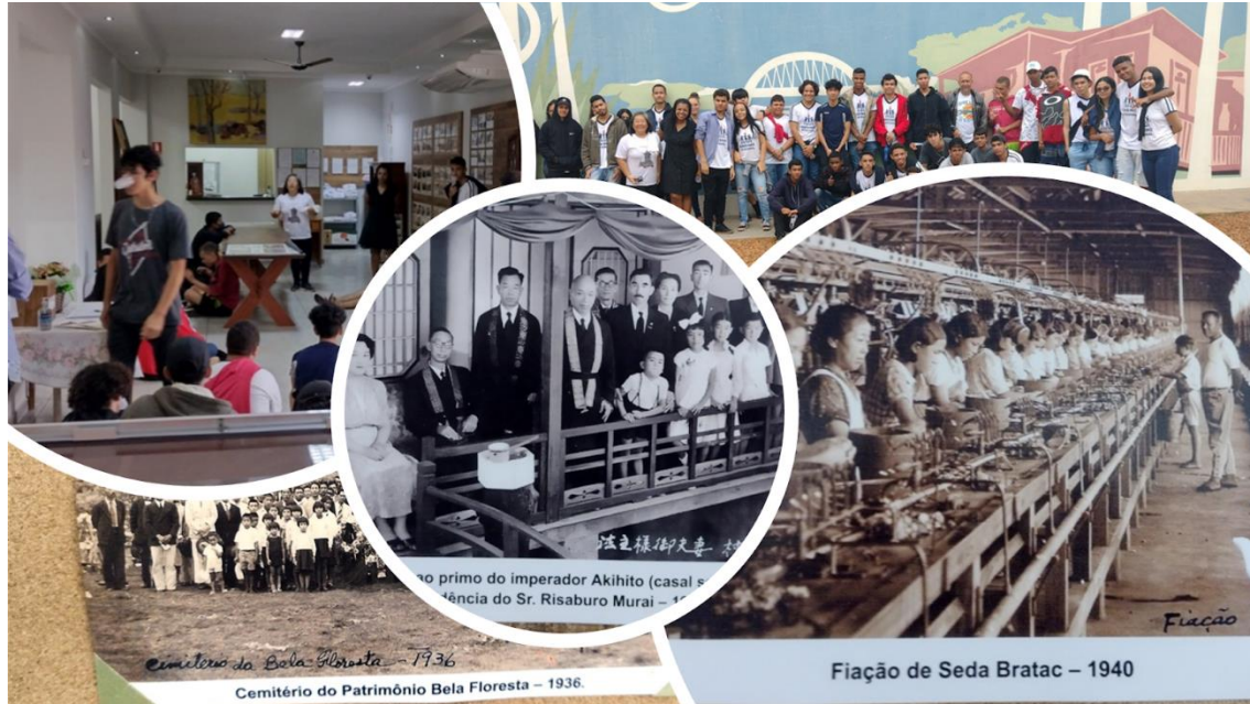
Imagem 5 - Visita ao museu do município de Pereira Barreto/SP

Local: Museu Municipal em Pereira Barreto/SP