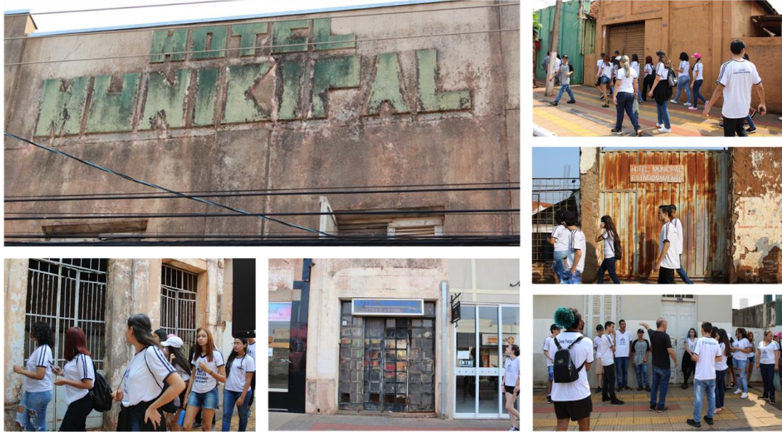
Imagem 7 - Percurso pelo calçadão e área central do município de Pereira Barreto/SP

Local: Percurso pelo calçadão e área central em Pereira Barreto/SP