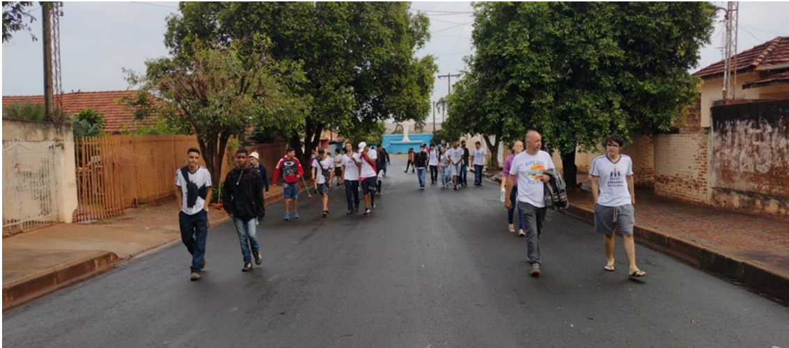
Imagem 9 - Antigo percurso da procissão da igreja ao Cemitério Campo Santo São José do município de Pereira Barreto/SP

Local: Antigo percurso da procissão da igreja ao Cemitério Campo Santo São José em Pereira Barreto/SP