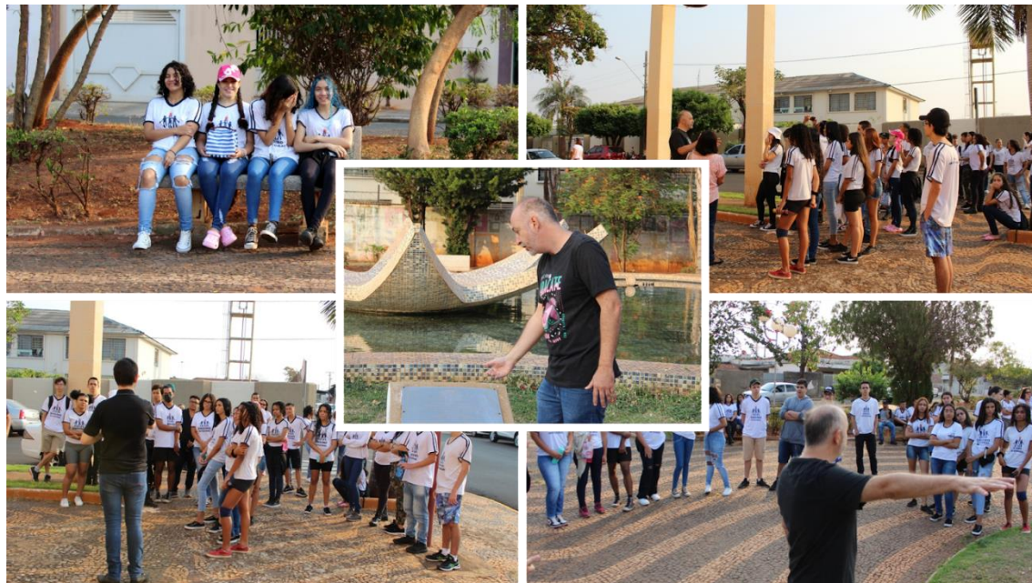
Imagem 6 - Visita a Praça Carlos Kato museu do município de Pereira Barreto/SP

Local: Praça Carlos Kato em Pereira Barreto/SP