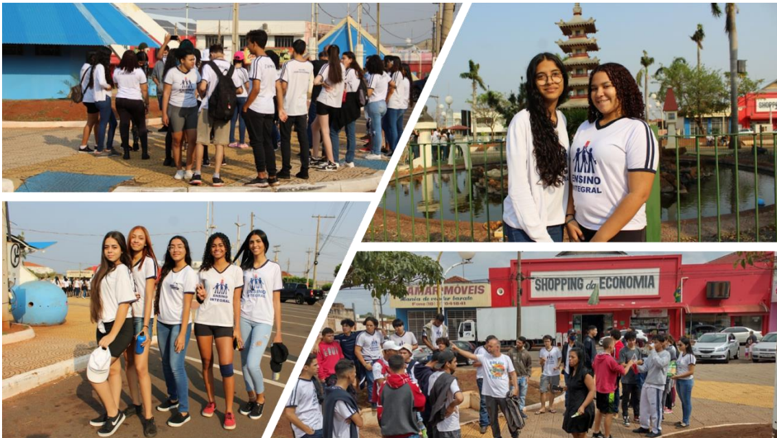
Imagem 8 - Visita a Praça da Bandeira Comendador Jorge Tanaka do município de Pereira Barreto/SP

Local: Praça da Bandeira Comendador Jorge Tanaka em Pereira Barreto/SP