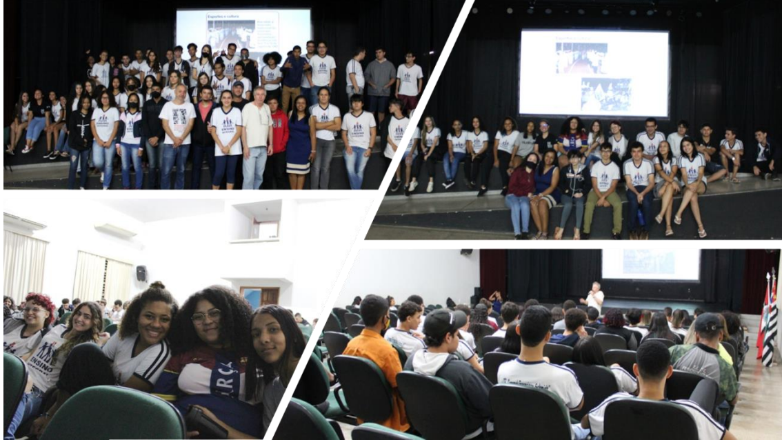
Imagem 3 - Palestra com escritor local

Local: Casa da Cultura do município de Pereira barreto/SP